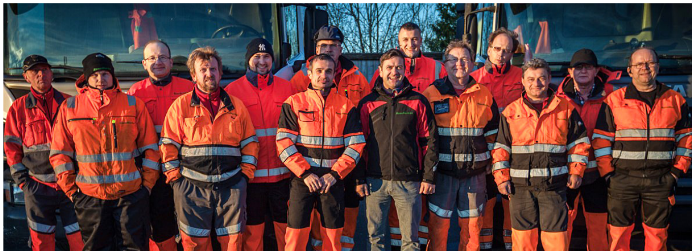
RenoNorden AS har utført renovasjonstjenesten for HIM siden 2010, og vant nylig anbudet om forlenging av denne kontrakten med 6-8 år. Her på bildet er det tretten flinke renovatører og en avdelingsleder.

HIM hjelper deg til å ta miljøansvar i hverdagen!