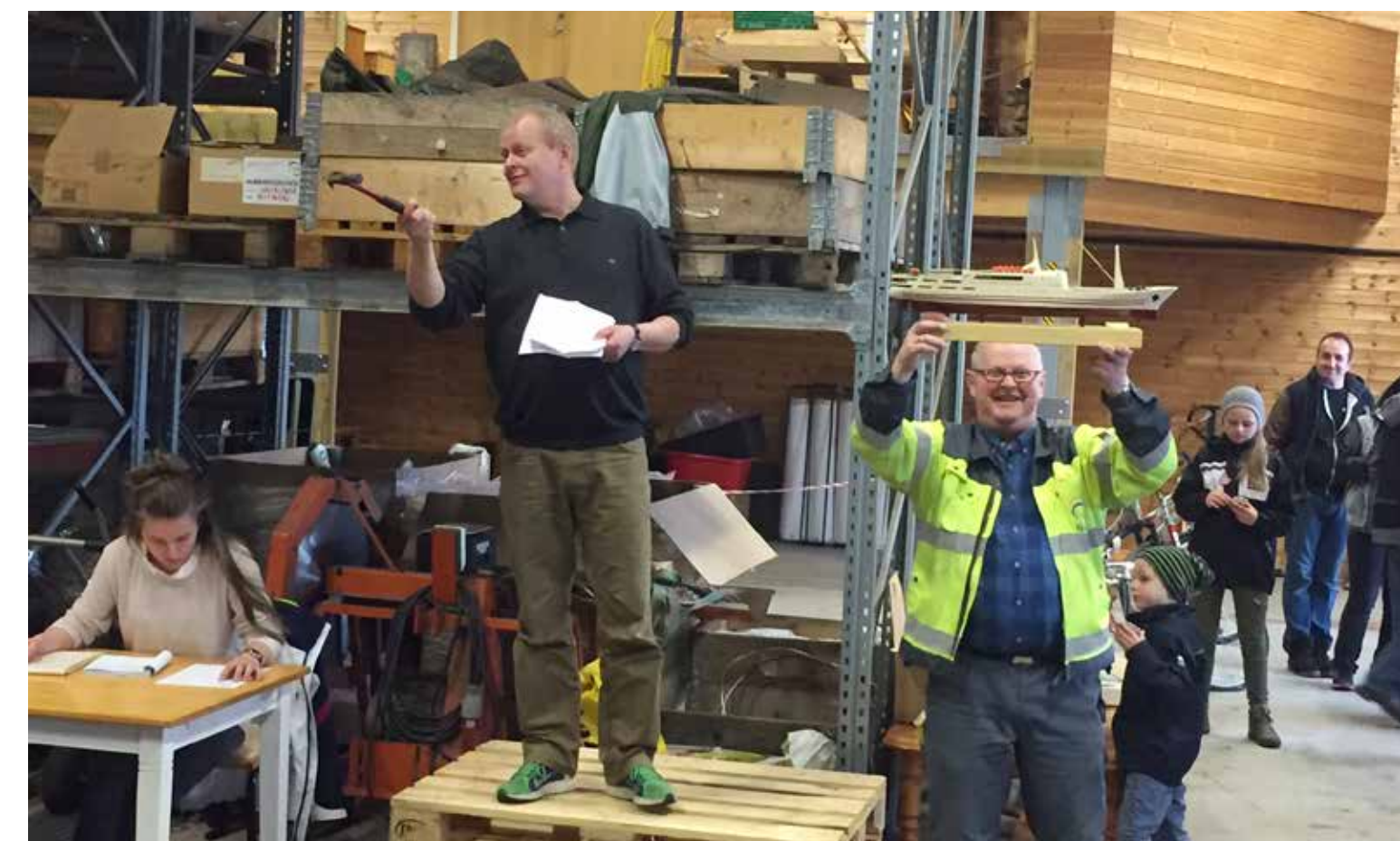
IVERSENKØGEN.NO Foto: HIM - Trykkt: hba.no

HIM har også hatt mobile mottak disse stedene nå i april.