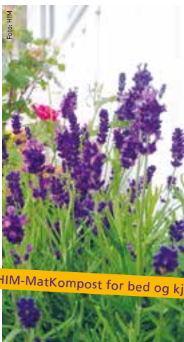
HIM-MatKompost for bed og kjøkkenhage