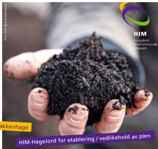
HIM-HageJord for etablering / vedlikehold av plen

HIM Haugaland Interkommunale Miljøverk IKS tlf.: 52 76 50 50 post@him.as www.him.as