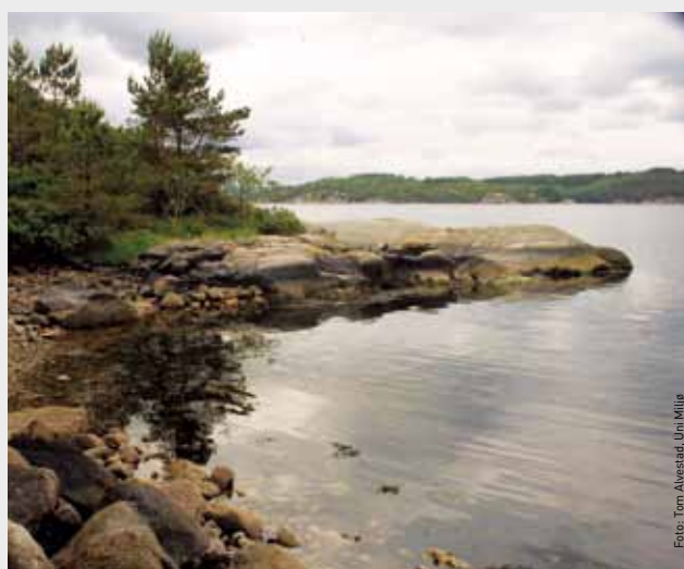
Strandsone like ved deponiet i Ålfjorden.

“Slik det ser ut i dag er det ingen tydelig påvirkning fra anlegget på livet i fjæresonen eller bunnforholdene i nærheten av anlegget.”