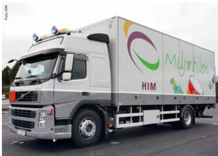
Mottaket vil bestå av en containerbil med tilhenger og spesialinnredede containere, HIM sin miljøbil og en 2-kamret renovasjonsbil. Innbyggerene kan levere alle typer avfall til dette mottaket mot kontant betaling.

Når du leverer ditt avfall til våre mottak og sorterer det, sørger du for at HIM kan behandle dette på beste måte for miljøet!